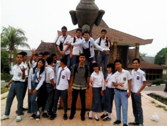
Studi wisata (Museum Balaputradewa)