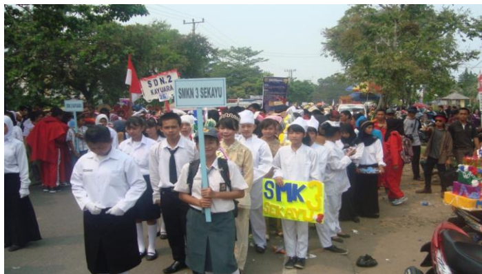
Foto 15. Kegiatan Karnaval Hut Muba