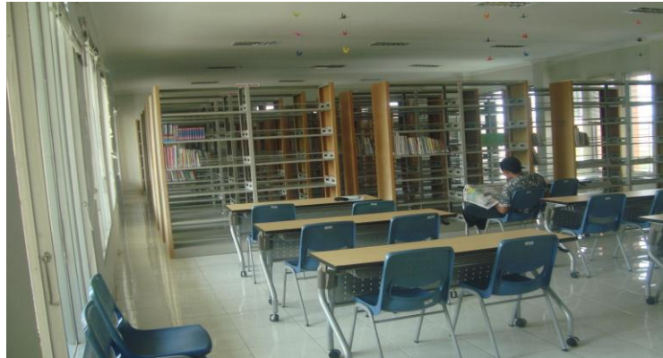
Foto 6. Perpustakaan SMK N 3 Sekayu