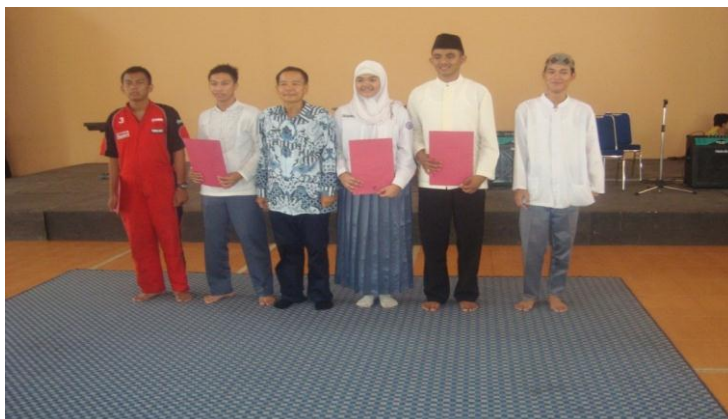
Foto 16. Penyambutan Kembalinya Siswa Magang SMK N 3 Sekayu