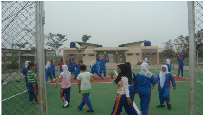
Foto 10. Ekstrakurikuler Volly Ball