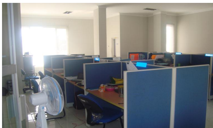
Foto 4. Ruang guru SMK 3 Sekayu