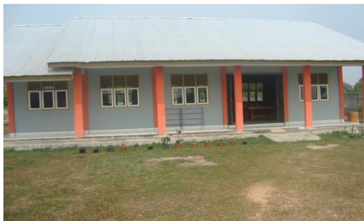
Foto 8. Gedung Bengkel Otomotif SMK N 3 Sekayu