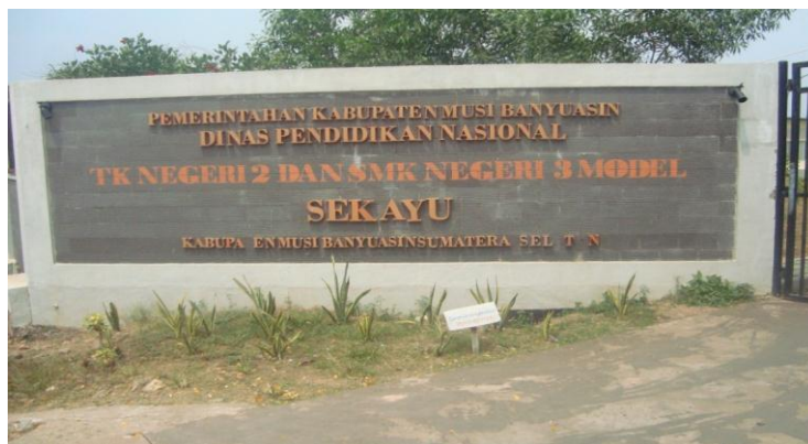
Foto 1. SMKN 3 Sekayu