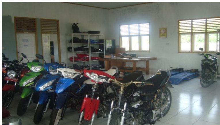
Foto 7. Bengkel Otomotif SMK N 3 Sekayu