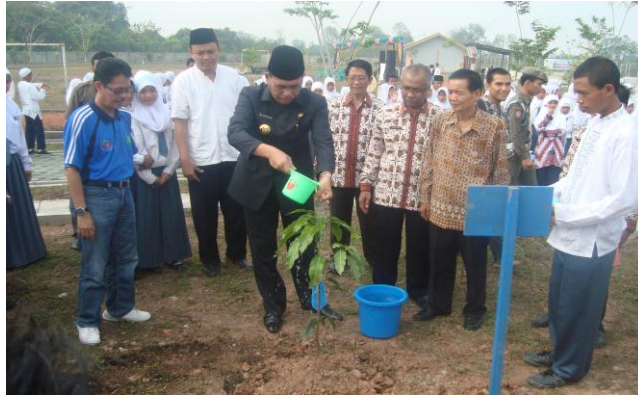
Foto 17. Penanaman pohon bersama Bapak bupati