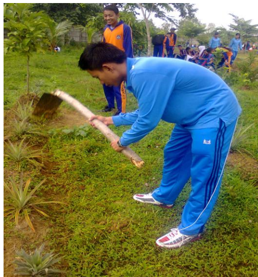
Foto 19. Pembersihan rumput rumput liar