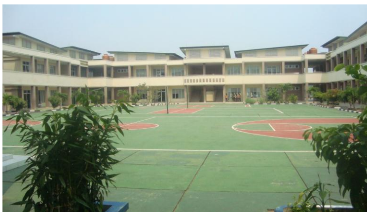
Foto 3. Area Dalam SMKN 3 Sekayu