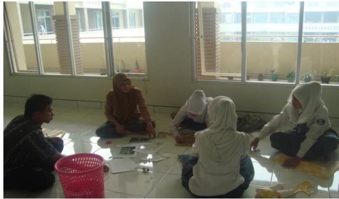
Foto 14. Bantu Menghiasi Ruang Perustakaan SMK N 3 Sekayu