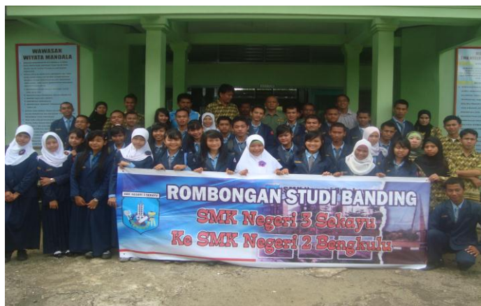
Foto 20. Study Banding di Smk 2 Bengkulu