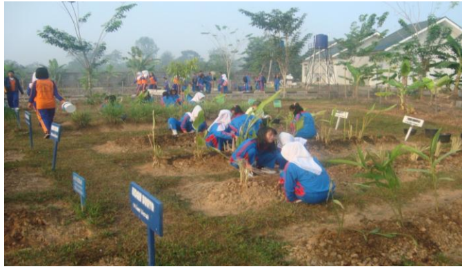
Foto 13. Kegiatan Cinta Lingkungan