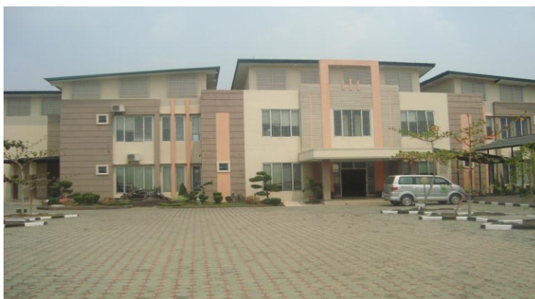
Foto 2. Gedung Bagian Depan SMKN 3 Sekayu