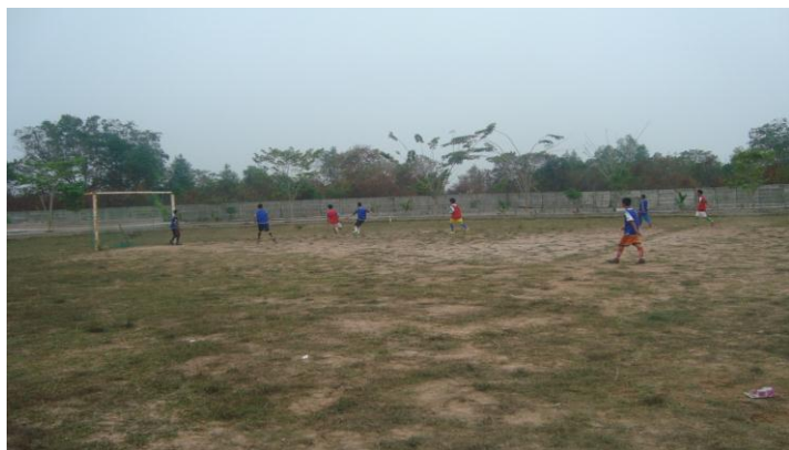
Foto 11. Ekstrakurikuler Sepak Bola