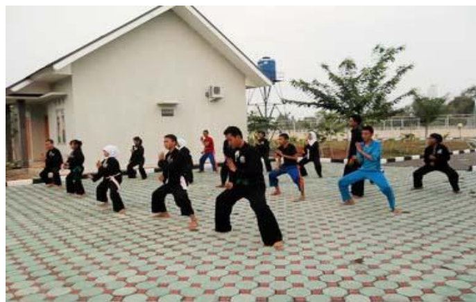
Foto 12. Pengembangan Diri Pencak Silat Kegiatan