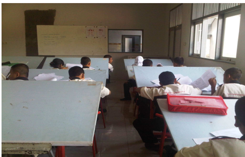
Evaluasi Pembelajaran (Pemberian Ulangan Harian)