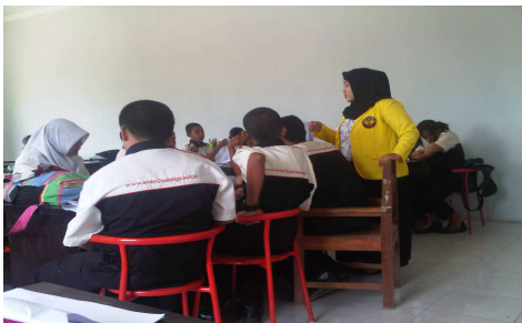
Mahasiswa Praktikan menyampaikan materi kepada para siswa