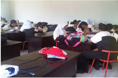
Proses Belajar Mengajar