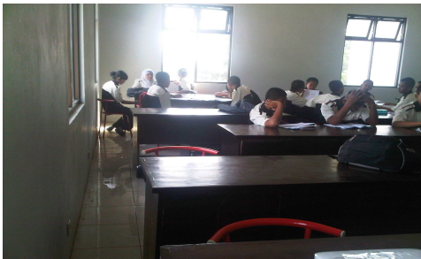
Setelah Penyampaian materi dibentuk sebuah kelompok untuk memperdalam materi yang disampaikan