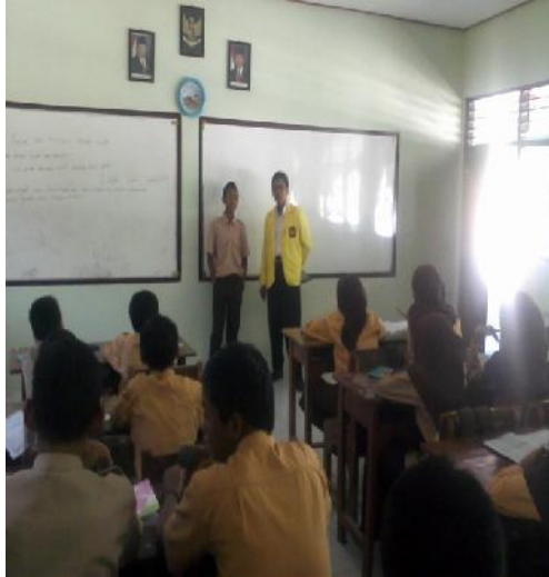
FOTO KEGIATAN MENGAJAR