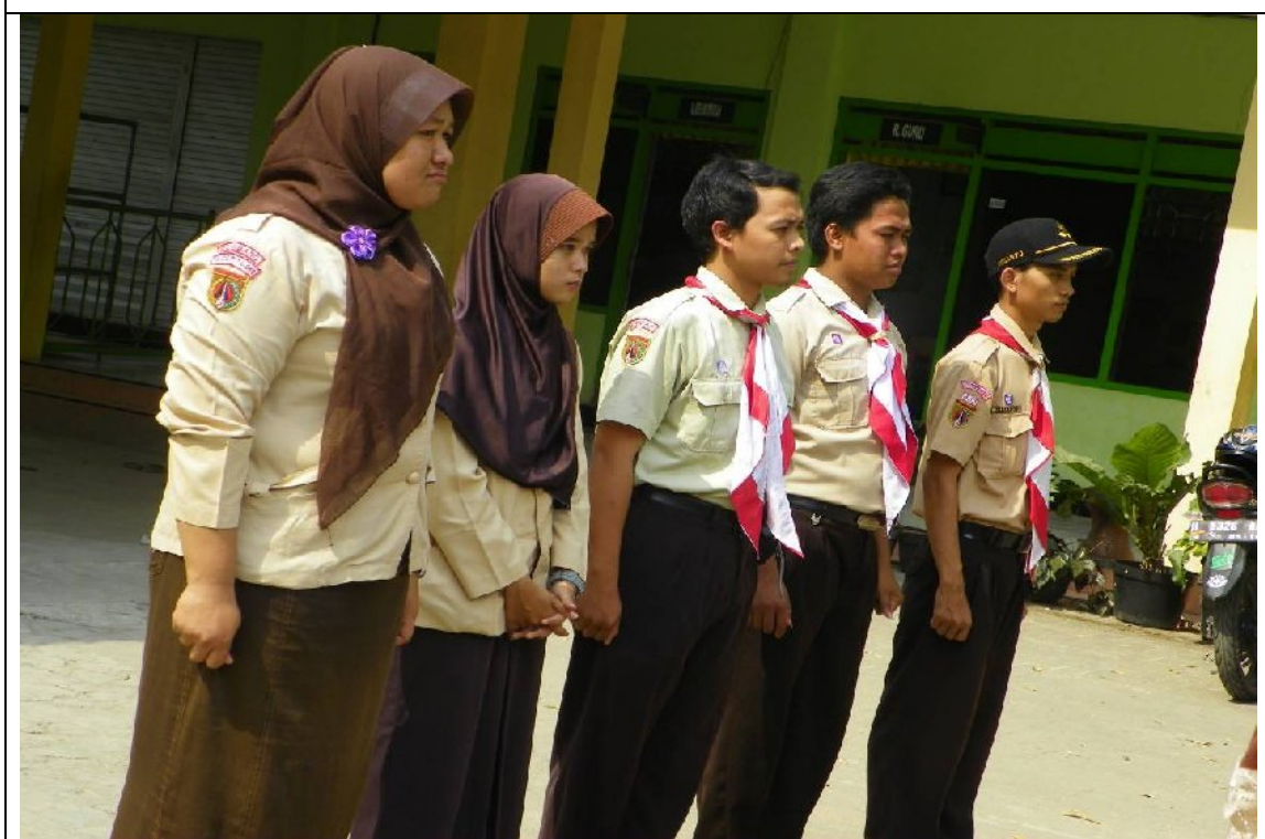
Saat Upacara pemberangkatan Pelantikan Dewan Penggalang