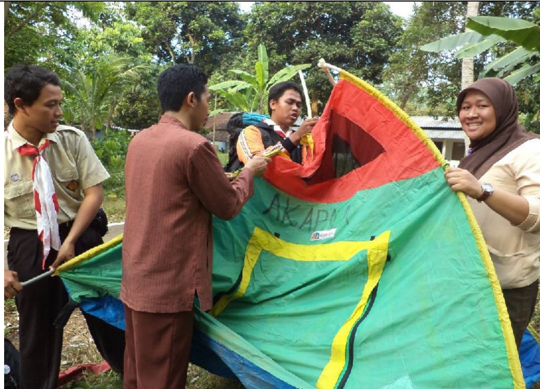
Persami saat Pelantikan Dewan Penggalang MTs NU Ungaran