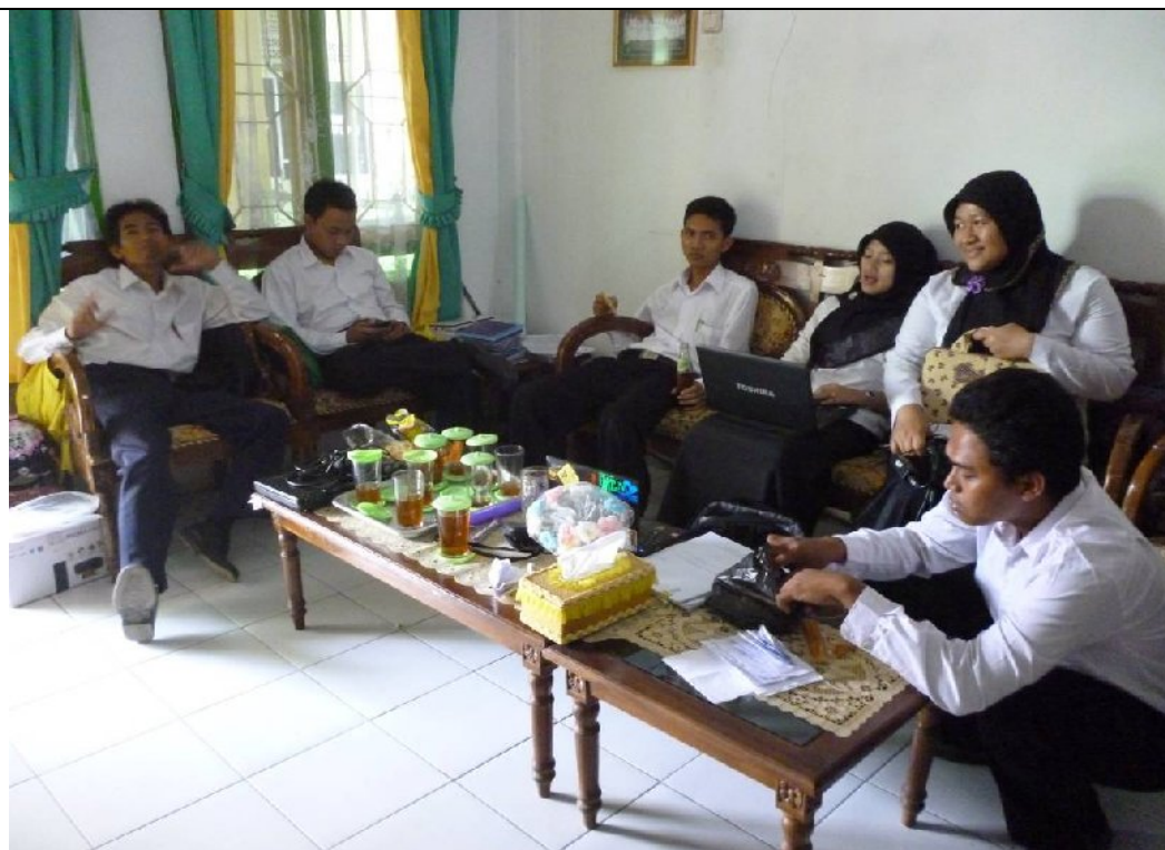
Berdiskusi kecil dengan Tim PPL