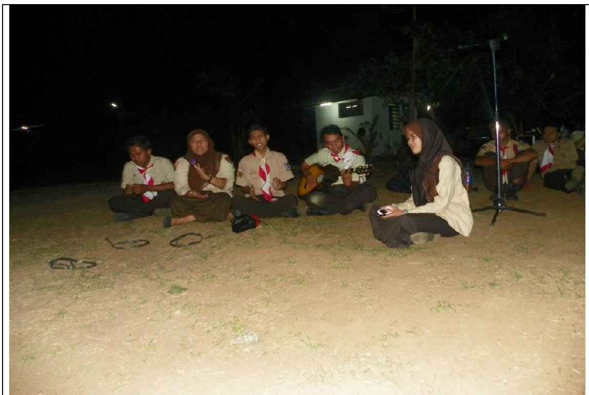
Pentas seni saat persami pelantikan Dewan Penggalang