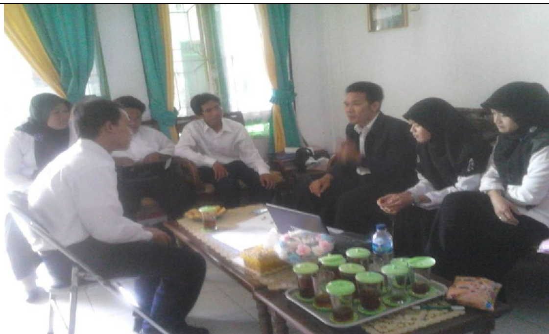
Bimbingan dengan Dosen Pembimbing