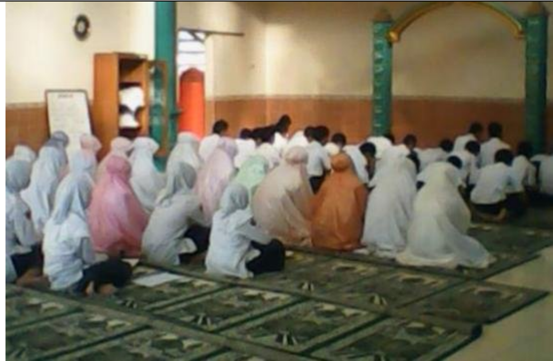
Kegiatan Sholat Dhuha MTs NU Ungaran