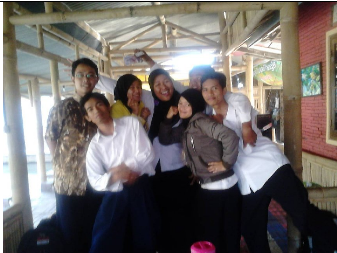
Kebersamaan tim PPL di MTs NU Ungaran