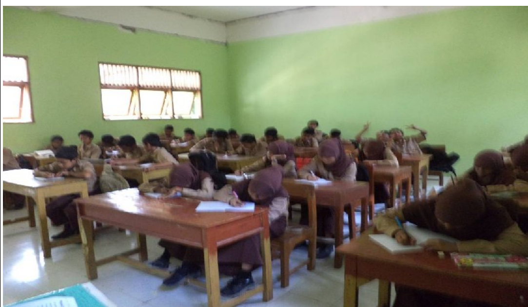
Suasana Pembelajaran di dalam kelas