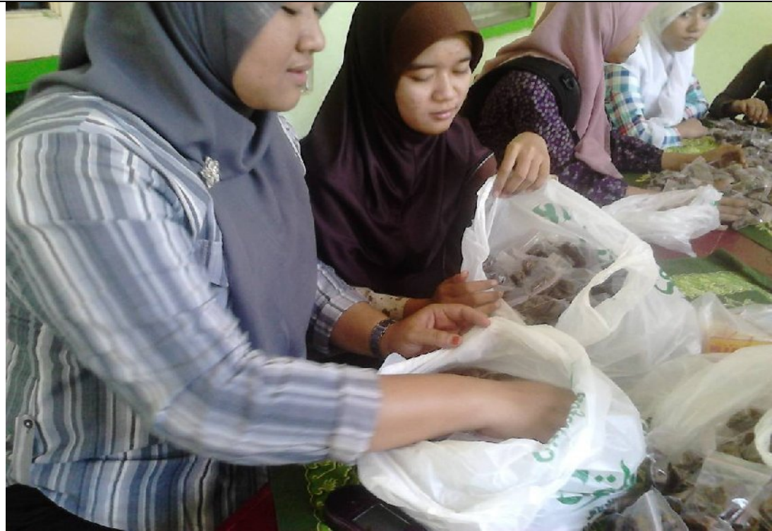
Mempersiapkan Buka Bersama