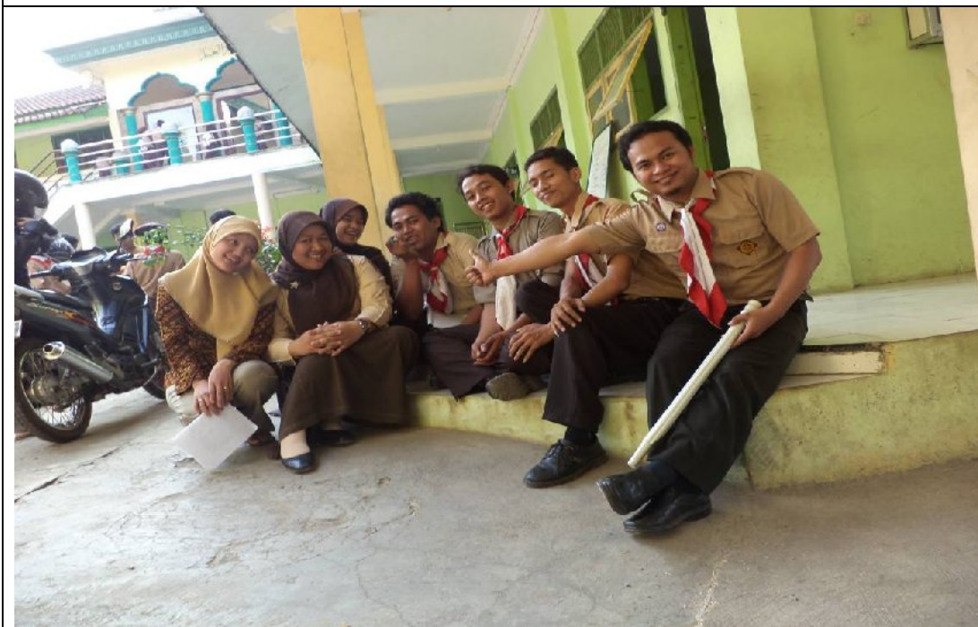
Kebersamaan Tim PPL Unnes dengan Pembina MTs NU Ungaran