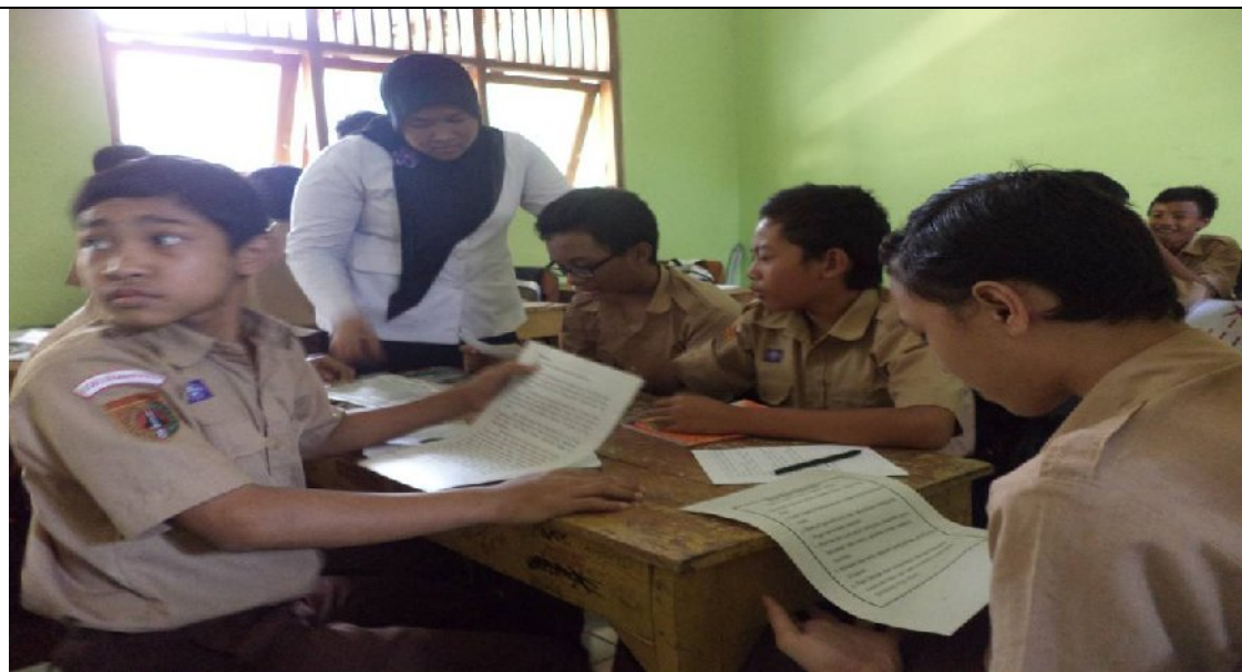
Membimbing kelompok diskusi