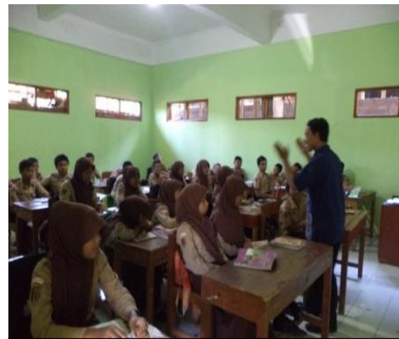
Pembelajaran Bahasa Indonesia di kelas 7 C