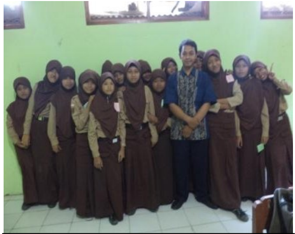
Foto bersama siswi kelas 7 C MTs NU