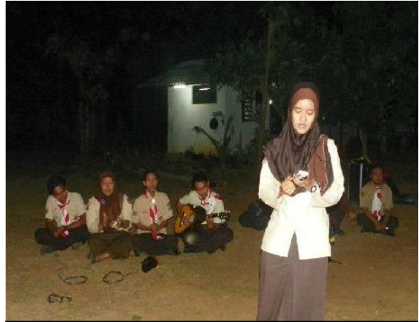
Kegiatan Pentas Seni saat Perkemahan Pelantikan Penggalang