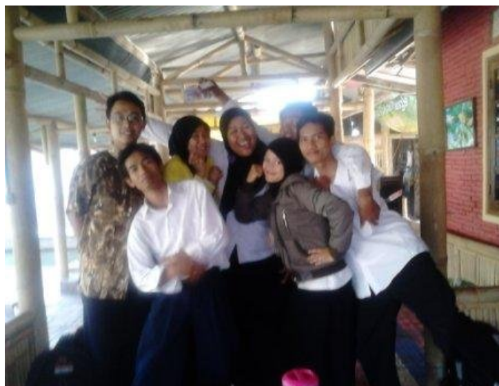
Kebersamaan bersama Tim PPL MTs NU Ungaran