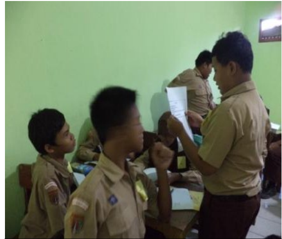
Kegiatan siswa dalam praktik membacakan teks perangkat upacara