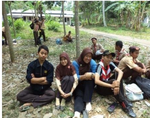
Selesai kegiatan Perkemahan Pramuka