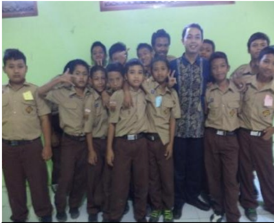
Foto bersama siswa kelas 7 C MTs NU