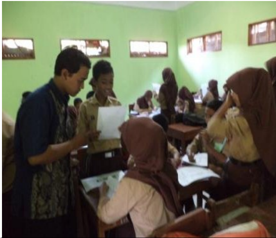
Kegiatan membimbing kelompok kecil