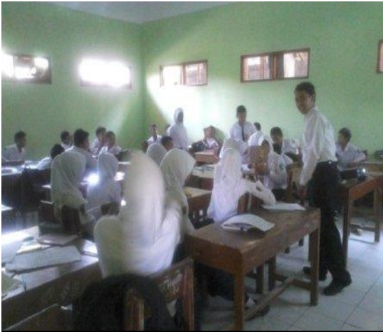
Pembelajaran Bahasa Indonesia di kelas 7C