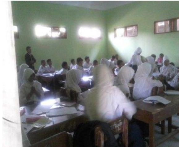
Pembelajaran Bahasa Indonesia di kelas 7 C di amati oleh Dosen Pembimbing