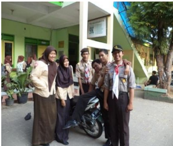
Foto bersama pembina Gudep MTs NU