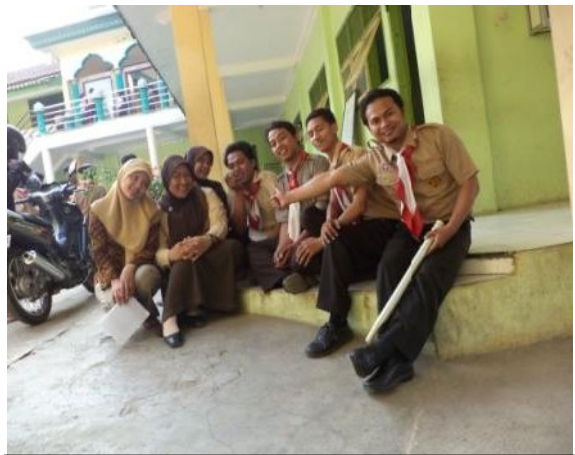
Foto bersama para pembina Gudep MTs NU Ungaran