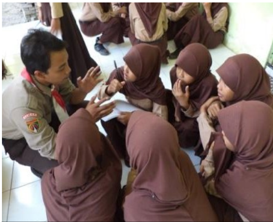
Kegiatan membimbing kelompok kecil di luar KRM ekstrakurikuler Pramuka