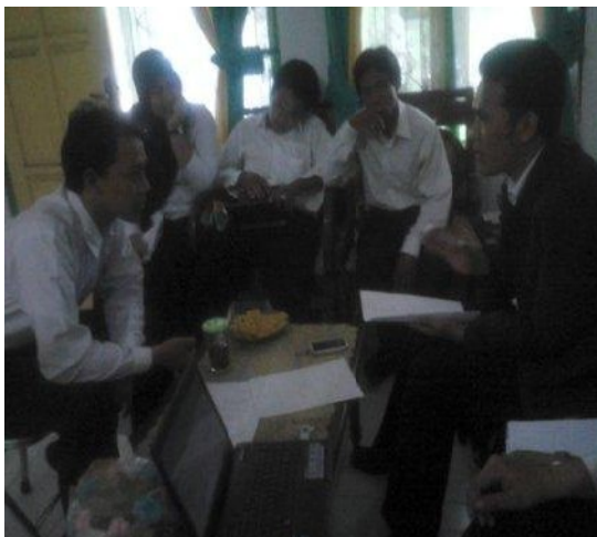
Kegiatan Pembimbingan bersama Dosen Pembimbing