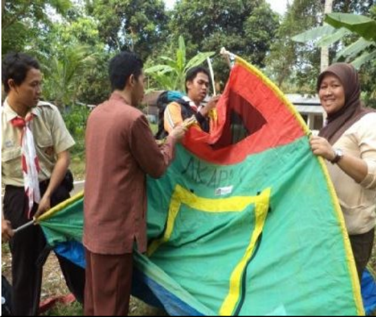
Kegiatan di luar KBM bersama siswa, Perkemahan Pramuka