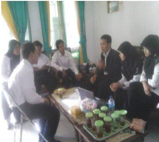
Kegiatan Refleksi bersama Dosen Pembimbing setelah Pembelajaran