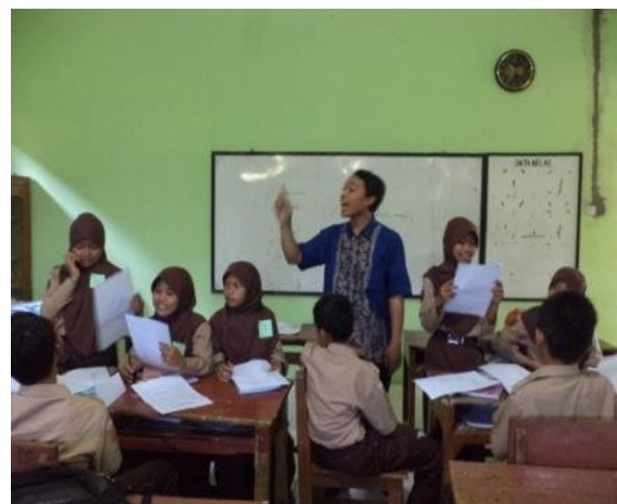
Guru Praktikan memberikan arahan