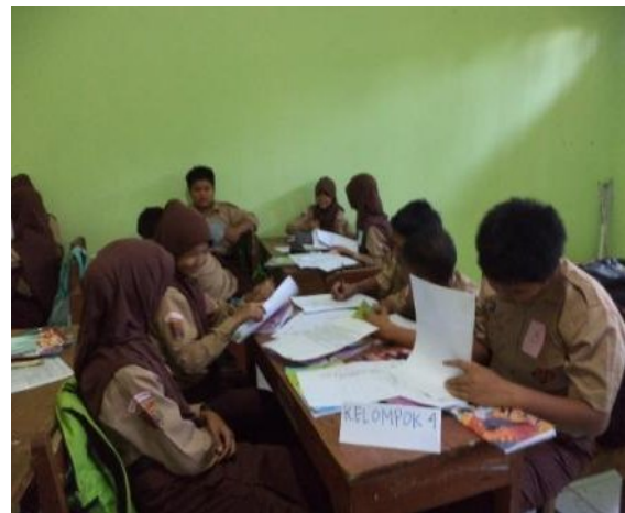
Kegiatan diskusi kelompok kecil