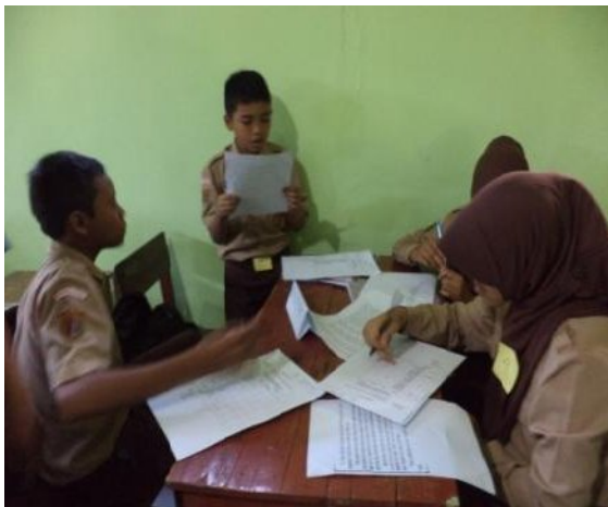
Kegiatan siswa dalam praktik membacakan teks perangkat upacara