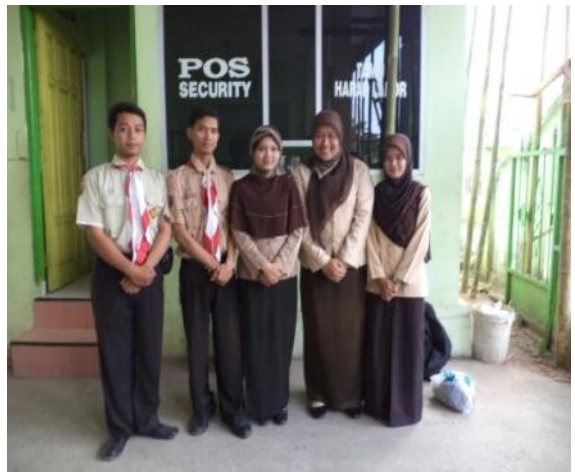
Foto bersama pembina Gudep MTs NU