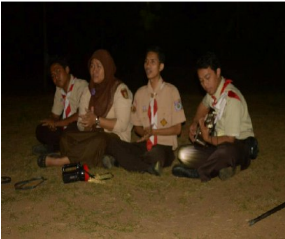
Kegiatan Pentas Seni saat Perkemahan Pelantikan Penggalang