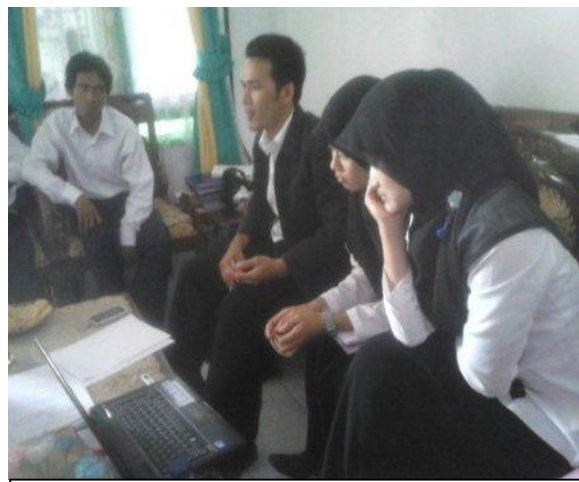
Kegiatan Pembimbingan bersama Dosen Pembimbing