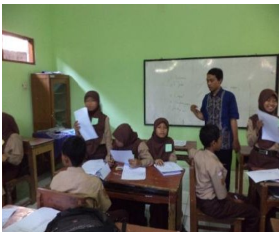
Kegiatan siswa menyapaikan hasil