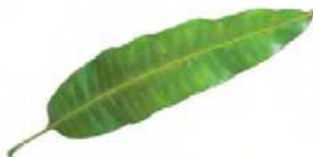
Daun mangga (daun tunggal)

Berdasarkan jumlah helai daun, daun dikelompokkan menjadi dua yaitu daun tunggal dan daun majemuk. Daun tunggal adalah daun yang memiliki satu helai daun pada setiap tangkainya, contohnya daun mangga. Daun majemuk adalah daun yang memiliki beberapa helai daun pada setiap tangkainya, contohnya daun putri malu.