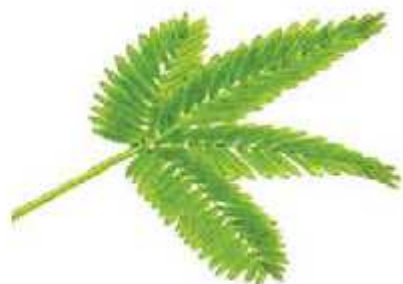
Daun putri malu (daun majemuk)