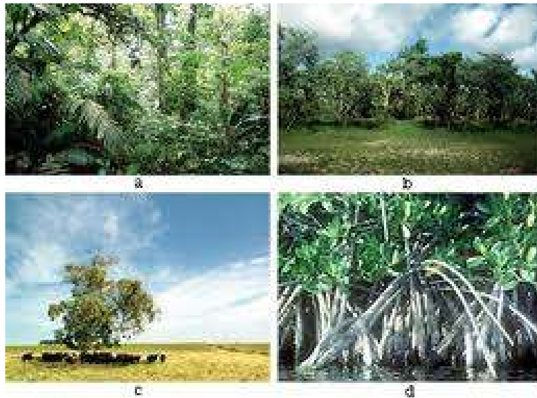
Hutan hujan tropis (a), Hutan musim(b), Sabana(c), Stepa (d)

Hutan hujan tropis terdapat di daerah tropis yang curah hujannya tinggi seperti Indonesia. Negara kita yang banyak sinar matahari, curah hujannya besar, dan suhu udaranya tinggi. Vegetasi utamanya adalah hutan hujan tropis. Hutan ini di jumpai dari dataran rendah hingga ke pegunungan. Hutan hujan tropis sangat lebat dan selalu hijau sepanjang tahun dan di dalamnya hidup beribu jenis tumbuhan, tumbuhan tersebut tersusun atas berbagai tingkat ketinggian, hingga seakan-akan membentuk lapisan-lapisan.