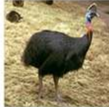
Jenis Fauna Australis, yang terdapat di bagian Timur Indonesia