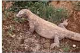
Jenis Fauna Peralihan dan Asli, yang terdapat di bagian Tengah Indonesia