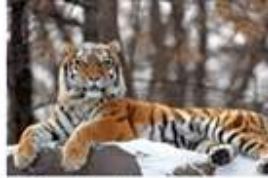
Jenis Fauna Asiatis, yang terdapat di bagian Barat Indonesia