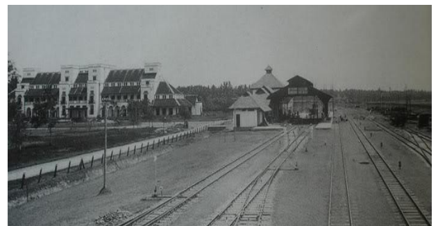
Gambar 6 : Stasiun dan Gedung SCS Tempo Dulu