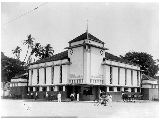
Gambar 5 : Kantor Pos Tegal