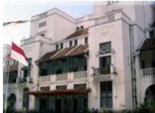
Gambar 2 : Gedung SCS