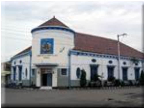
Gambar 1 : Danal Tegal