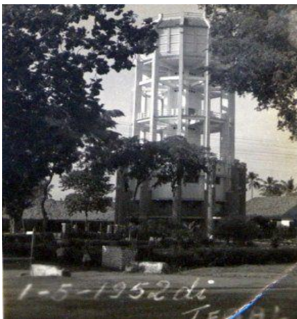
Gambar 3 : Waterleiden