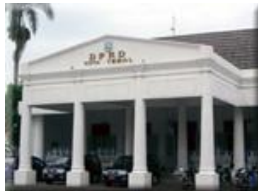
Gambar 4 : Gedung DPRD