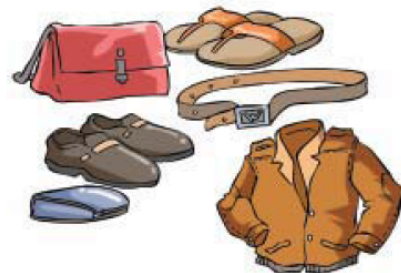
Gambar 3.10 Produk dari kulit hewan

Untuk memenuhi kebutuhan hidupnya terkadang manusia tidak memedulikan keseimbangan ekosistem. Misalnya ular, buaya, dan harimau diburu untuk diambil kulitnya. Gajah diburu untuk diambil gadingnya dan badak diburu untuk diambil cularnya. Kematian hewan-hewan tersebut dalam jumlah besar dapat mengganggu keseimbangan lingkungan.