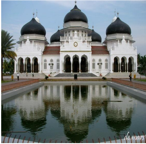
Masjid Raya Baiturrahman