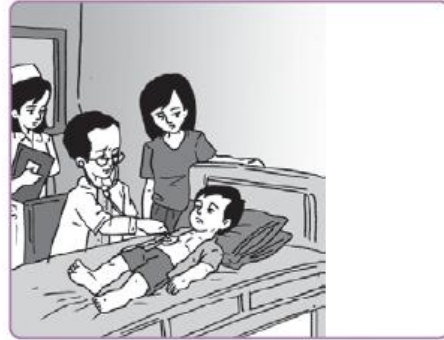
Gambar 6.11 Ibu membawa Rian ke dokter