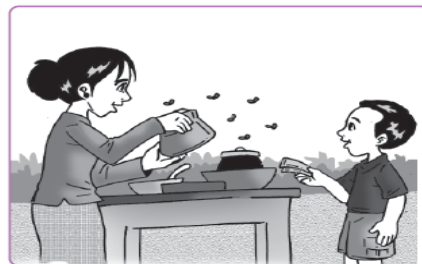
Gambar 6.9 Rian membeli kue di pinggir jalan