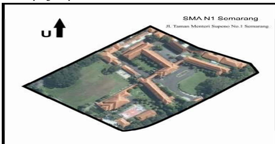
SMA Negeri 1 Semarang (tampak atas)