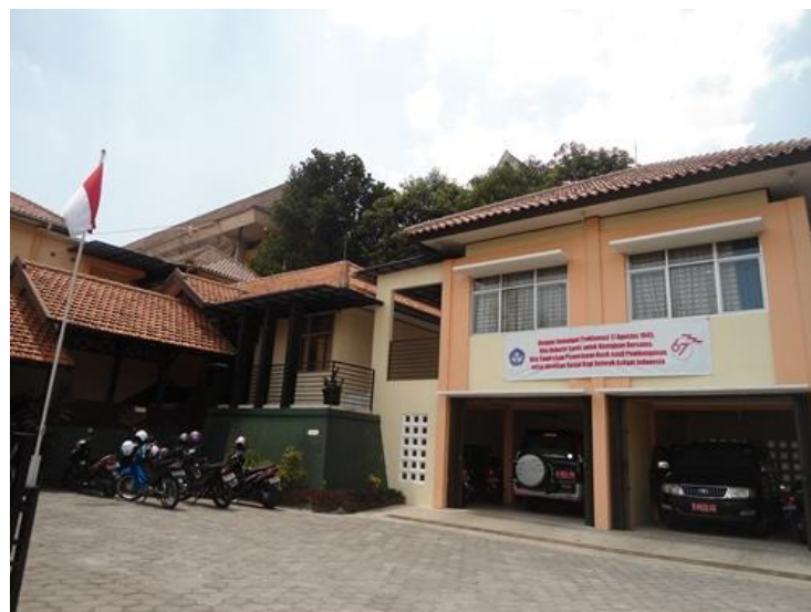
Halaman Balai Pengembangan Multimedia Pendidikan