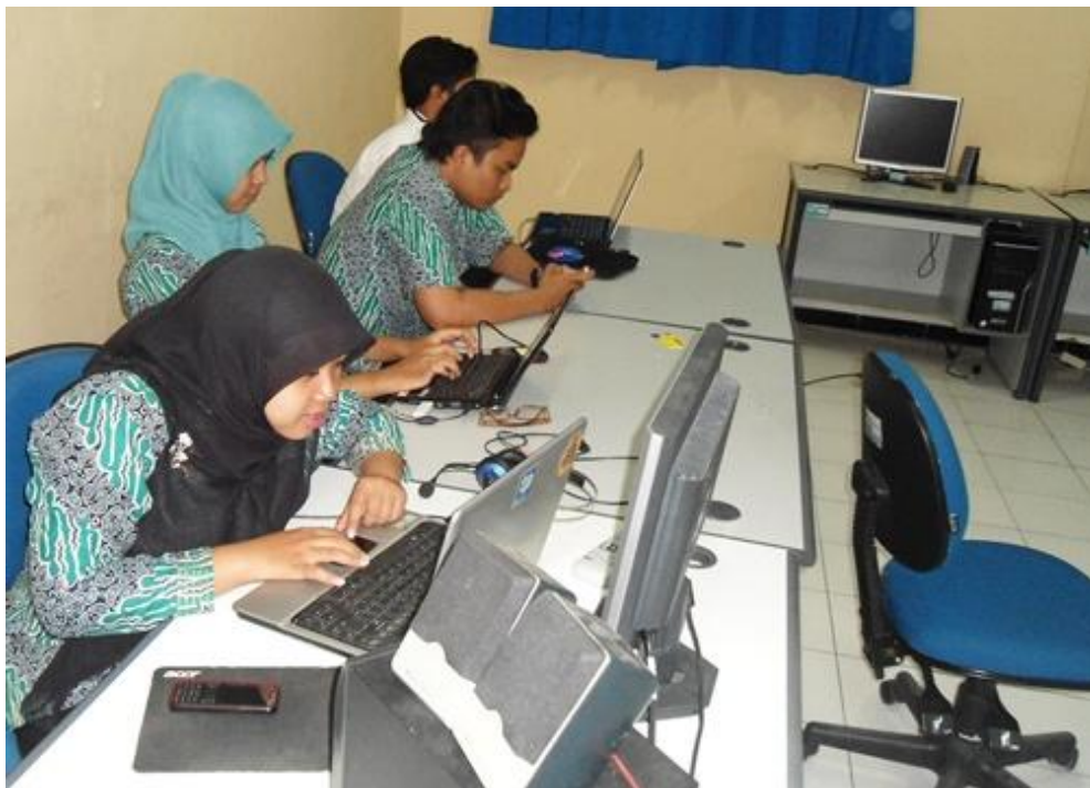
Mahasiswa PPL Teknologi Pendidikan UNNES