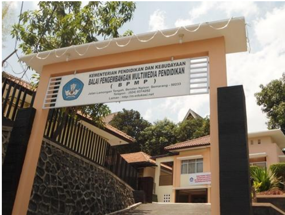
Balai Pengembangan Multimedia Pendidikan