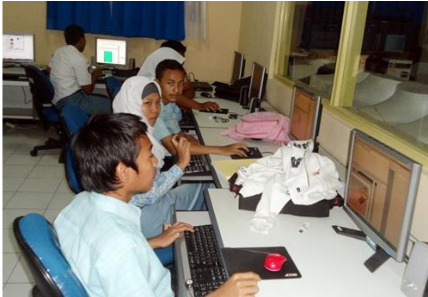
Ruang Laboratorium Sekaligus Ruang Prakerin SMK dan PPL Mahasiswa