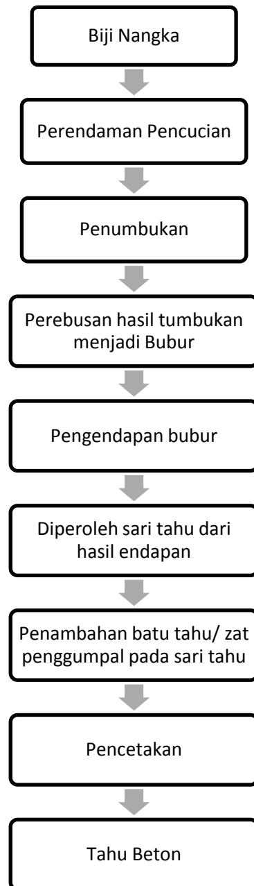
Gambar 1. Diagram Proses Pembuatan Tahu Beton