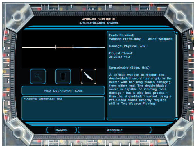
Buat atau upgrade senjata, armor, dan item lain di Workbench. Sedangkan untuk membuat medpac dan item sejenis, Anda bisa memanfaatkan Lab Station.

Pertemuan : Ebon Hawk. Kelas awal : Jedi Sentinel-level 6. Tipe : Netral.