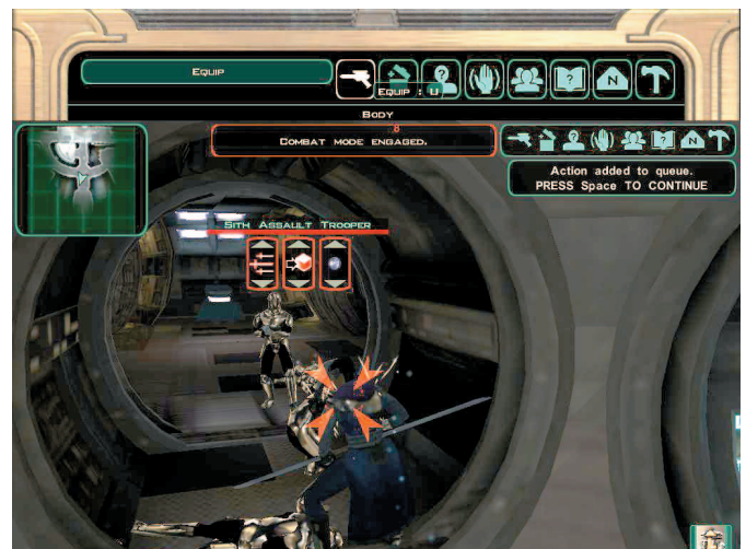
Pertarungan akan berlangsung secara otomatis. Jika Anda mengaktifkan game tanpa mengeset serangan, karakter akan menyerang dengan serangan standar.