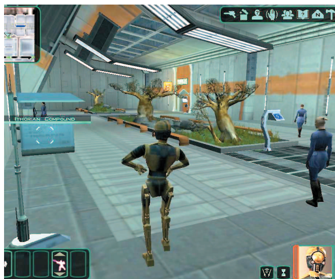
Quest tertentu kadang mengharuskan Anda mengontrol karakter yang tak ada dalam tim. Setelah quest selesai, set-up kembali anggota tim Anda.