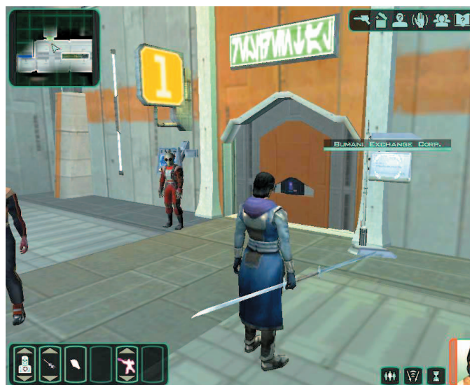
Anda bisa membuka pintu atau gerbang yang dijaga dengan cara kekerasan. Tapi jangan lakukan hal tersebut pada Bumani Exchange Corp di Peragus.