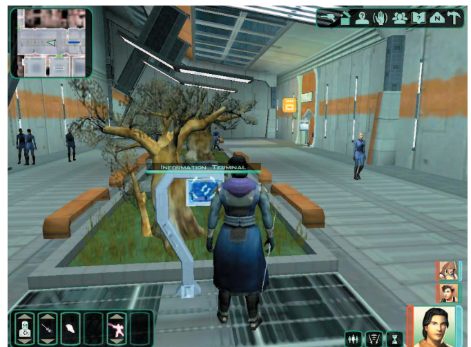
Jangan lewatkan Information Terminal di Peragus. Selain bisa men- download Map , juga berfungsi sebagai teleporter untuk berpindah secara cepat.