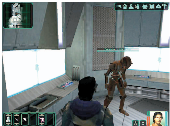
Droid HK-47 ini bisa Anda temukan di kapal Anda, Ebon Hawk. Namun, perbaikilah ia hanya setelah mengunjungi Narshaddaa.