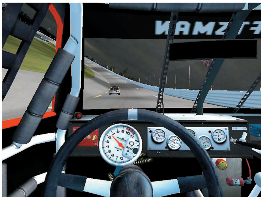
Mode camera melalui cockpit. Pilihan mode kamera lainnya hanya dimungkinkan dengan mengakses menu setting.

Selain sisi manajemen, game ini memberi pengaturan setting yang lengkap. Bahkan situasi balapan bisa dibuat mendekati kondisi sesungguhnya. Sebagai contoh, ada opsi untuk mengaktifkan fitur damage ban, dan kemung-