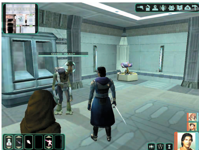
Memilih untuk membantu salah satu pihak dari NPC yang saling bermusuhan, akan mempengaruhi alur cerita, quest , dan point Dark atau Light Side Anda.

Dipengaruhi Intelligence . Berguna untuk membuka pintu atau container yang terkunci. Biasakan