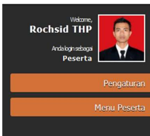
Gambar 4. Menu Samping

Di samping kiri terdapat dua buah menu yaitu menu pengaturan dan menu peserta . Menu pengaturan digunakan untuk mengubah nama, password dan gambar profil. Sedangkan menu peserta digunakan untuk mengisi kuisiner dan daftar ulang .